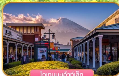
โกเทมบะเฮ้าท์เล็ท